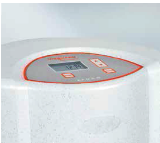
Электронная панель управления фильтра Aquacarbon обеспечивает простую и удобную эксплуатацию